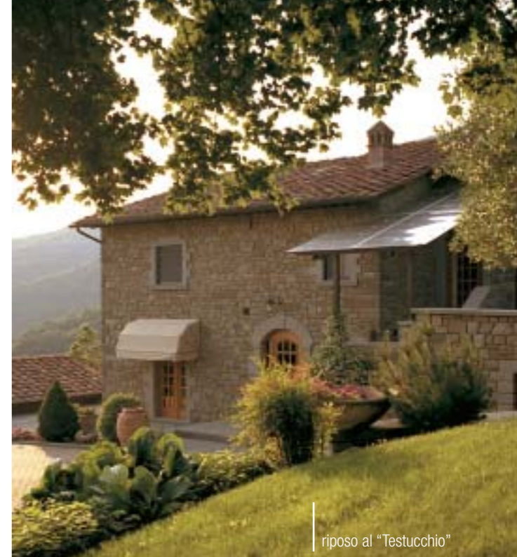
riposo al “Testucchio”

Ma non è tutto qui. Ciascuna casetta è collegata con il