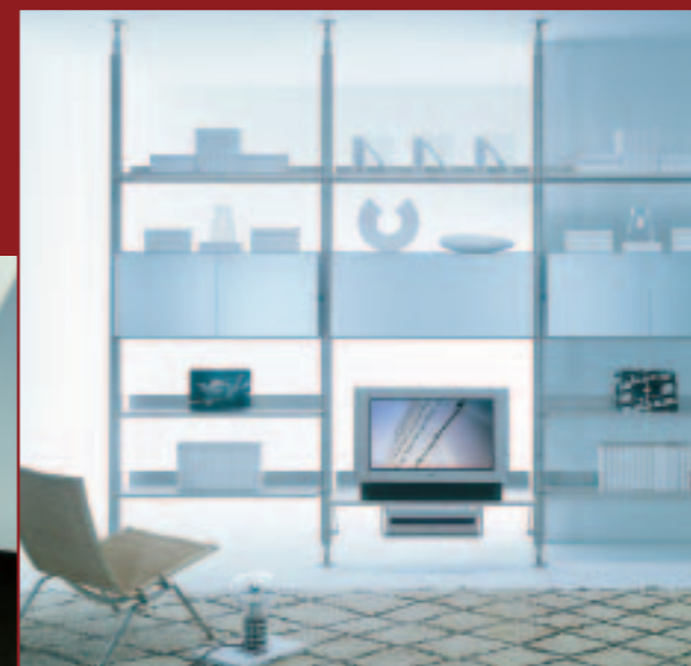
sistema parete ARMIDA 350 design: Caronni Bonanomi

Sedia impilabile con struttura in acciaio. Seduta e schienale in propilene in vari colori.