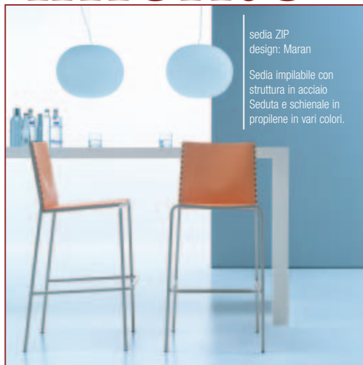
sedia ZIP design: Maran

In questo senso DESALTO offre garanzie assolute, grazie allo stabilimento interno che ricopre un'area complessiva di 10.000 mq dove è stata da poco rinnovata l'area espositiva.