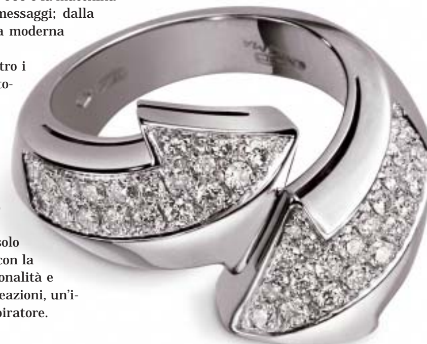
serie ENIGMA collezione Freccia 1 anello

un viaggio alla scoperta della nuova linea di gioielli e orologi di Gianni Bulgari