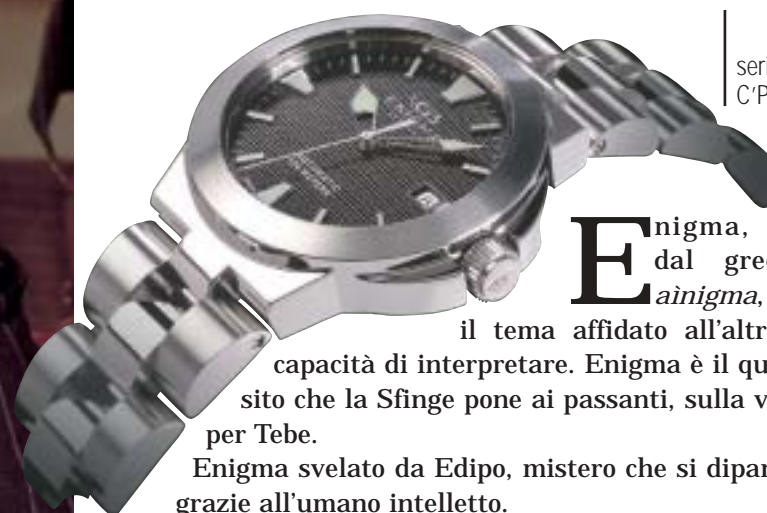
serie ENIGMA C'Pillar 38 Automatic

E nigma, dal greco ainigma , è il tema affidato all'altrui capacità di interpretare. Enigma è il quesito che la Sfinge pone ai passanti, sulla via per Tebe.